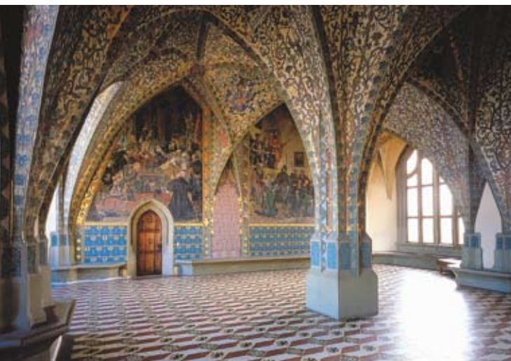
Große Appellationsstube in der Albrechtsburg Meissen

Die Albrechtsburg Meissen thront hoch über der Stadt und ist in vielerlei Hinsicht von herausragender Bedeutung. Sie besticht nicht nur durch ihre großartige Architektur, sondern ist auch Zeugnis der kulturellen, finanziellen und politischen Potenziale der wettinischen Landesherren. Mit der Einrichtung als Produktionsstätte für das erste europäische Porzellan wirkte das Schloss weit über die Landesgrenzen hinaus.