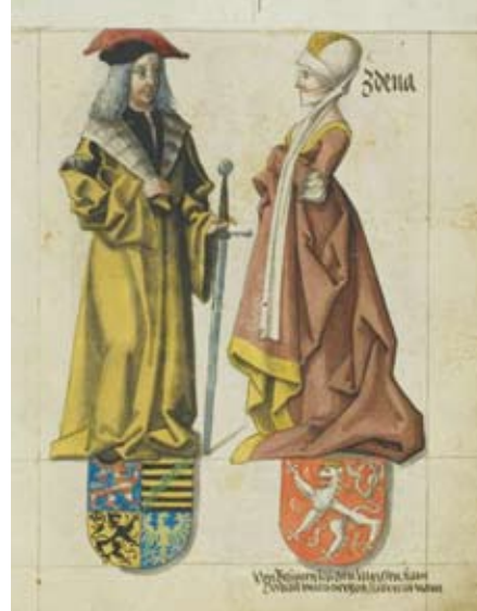
Herzog Albrecht der Beherzte mit seiner Frau Sidonie im Sächsischen Stammbuch

Kommen Sie mit auf eine spannende Entdeckungsreise! Historische Exponate und virtuelle Inszenierungen präsentieren Baukunst, Macht und Porzellan in Deutschlands ältestem Schloss.