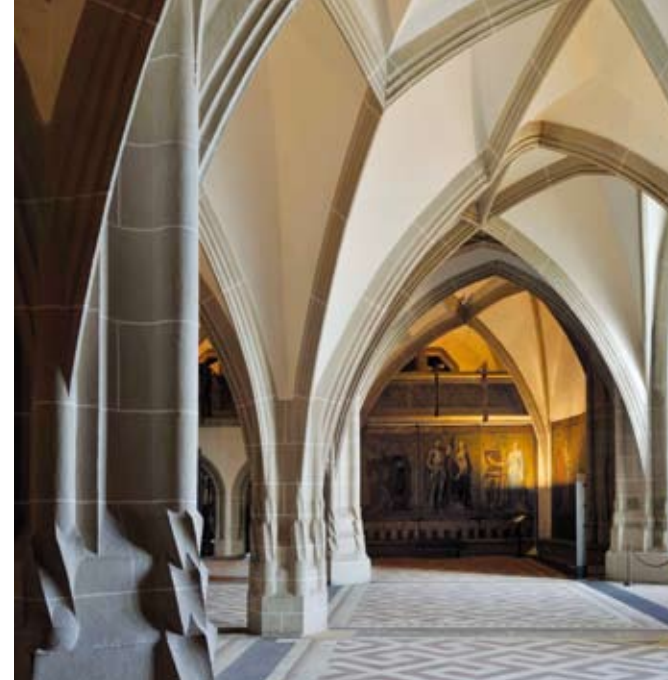
Großer Saal in der Albrechtsburg Meissen

Auch die im 19. Jahrhundert kunstvoll entstandenen Wandmalereien zeigen dem Besucher eindrucksvoll sächsische Geschichte aus dem Blickwinkel vergangener Tage. Zu sehen sind zahlreiche Episoden aus dem Leben der Brüder Ernst und Albrecht von Wettin. Außerdem werden die Bestürmung des Burgbergs und die Entdeckung des Arkanums der Porzellanherstellung bildhaft in Szene gesetzt.